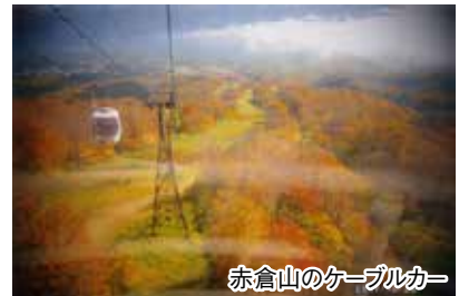
赤倉山のケーブルカー