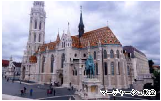
マーチャーシュ教会