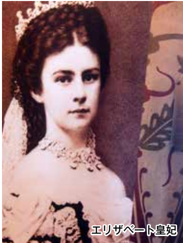
エリザベート皇妃