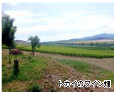
トカイのワイン畑