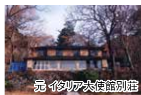
元イタリア大使館別荘