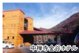
中禅寺金谷ホテル