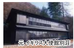
元イギリス大使館別荘