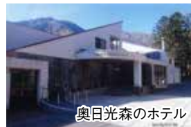
奥日光森のホテル