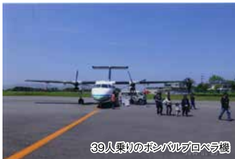
39人乗りのボンバルプロペラ機

5月2日、空路福岡に入り同じ空港から39名乗りの小型ボンバルプロペラ機で福江島を訪れた。五島列島は福江島・久我島・奈留島の他小さな島々が散在している。私どもはレンタカーで福江島を廻った。