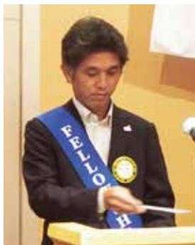
親睦ソングリーダー