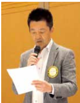
幹事報告(中越副幹事)